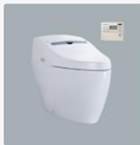
智慧型超級馬桶 型號：AFC214G 牌價NT$：100,000 建議售價NT$：55,000