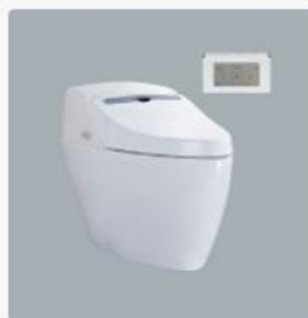
智慧型超級馬桶 型號：AFC240G 牌價NT$：120,000 建議售價NT$：66,000