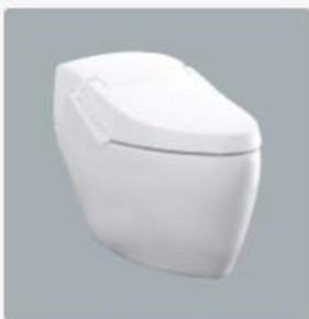
智慧型超級馬桶 型號：AFC280G 牌價NT$：88,000 建議售價NT$：48,400