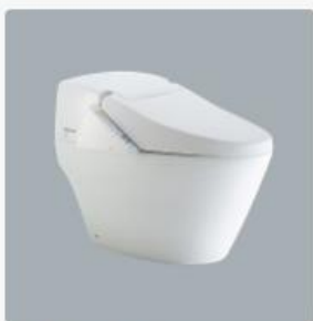
智慧型超級馬桶 型號：AFC209G 牌價NT$：88,000 建議售價NT$：48,400