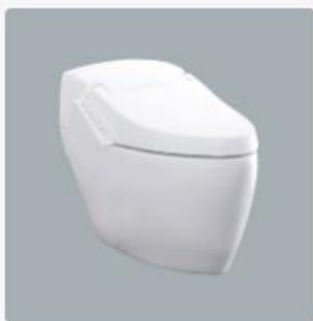
智慧型超級馬桶 型號：AFC284G 牌價NT$：88,000 建議售價NT$：48,400