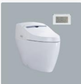
智慧型超級馬桶 型號：AFC230G 牌價NT$：120,000 建議售價NT$：66,000